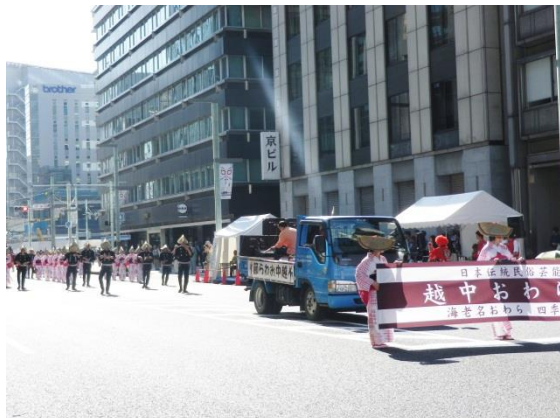
越中おわら節の踊り手達