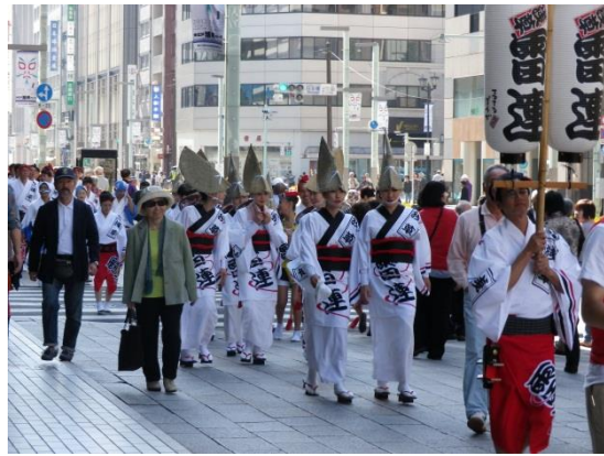
阿波踊りの踊り子達