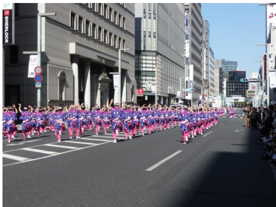
『かっぽれ』を踊る地元婦人会の人達