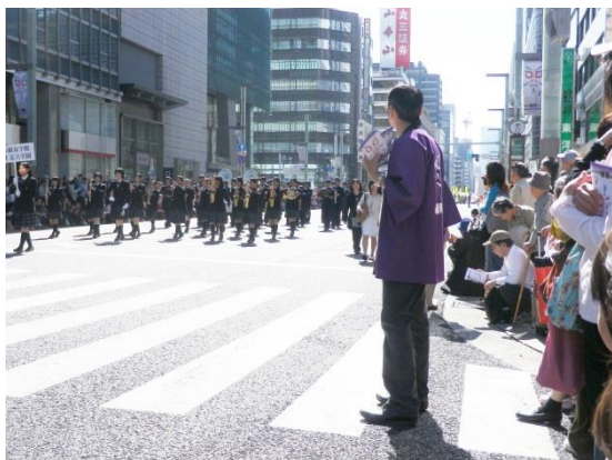
日本橋女学館と足立学園の吹奏楽部

官公庁のパレードから始まり、日本各地の踊りが披露され、私も時間を忘れて見入りま した。