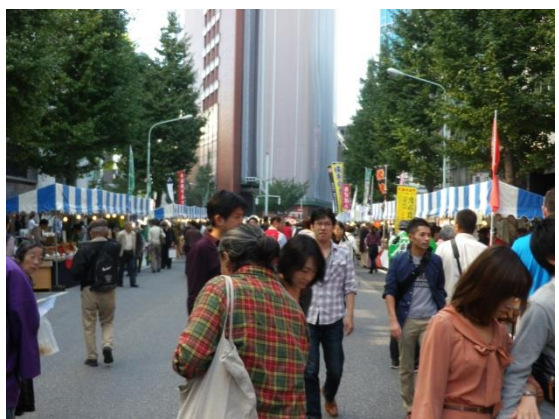
日本橋室町に特設された室町市場