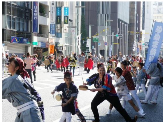
武州妻沼練り込み囃子