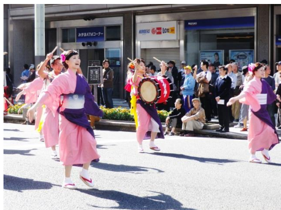
大江戸さんさ踊りの踊り手達