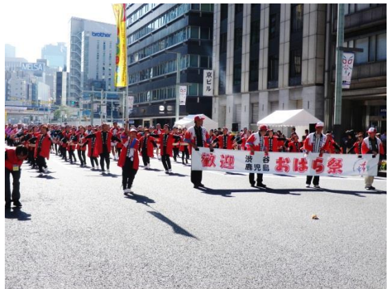
鹿児島おはら節の踊り手達