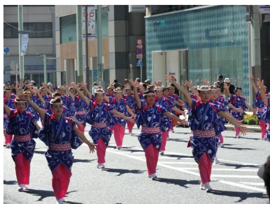
『かっぽれ』を踊る地元婦人会の人達