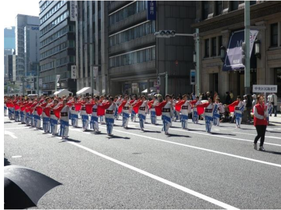
中央区民謡連盟の人達