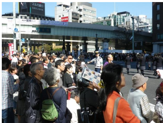
日本橋に陣取る見物人たち