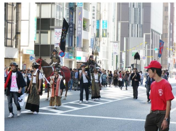
相馬騎馬武者行列