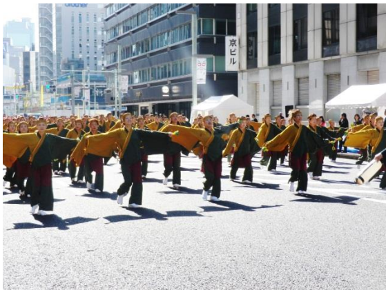
前橋だんべえ踊り